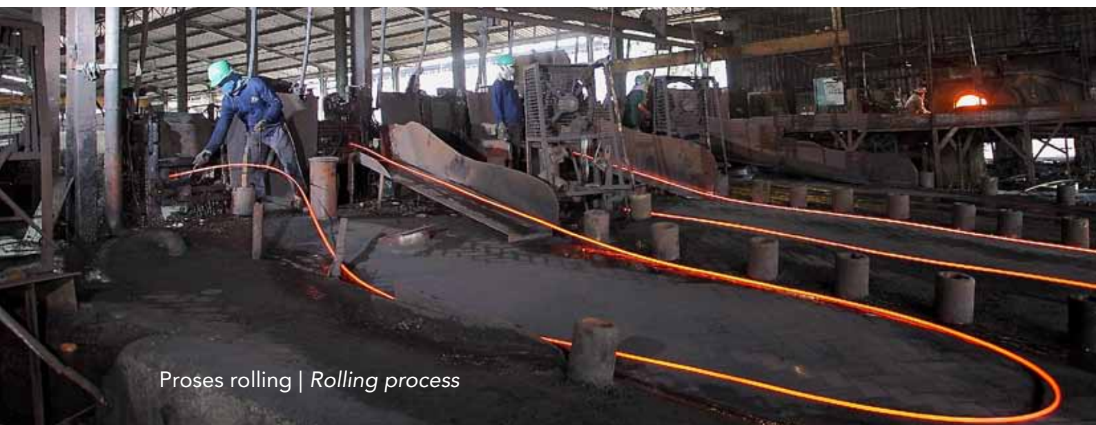
Proses rolling | Rolling process