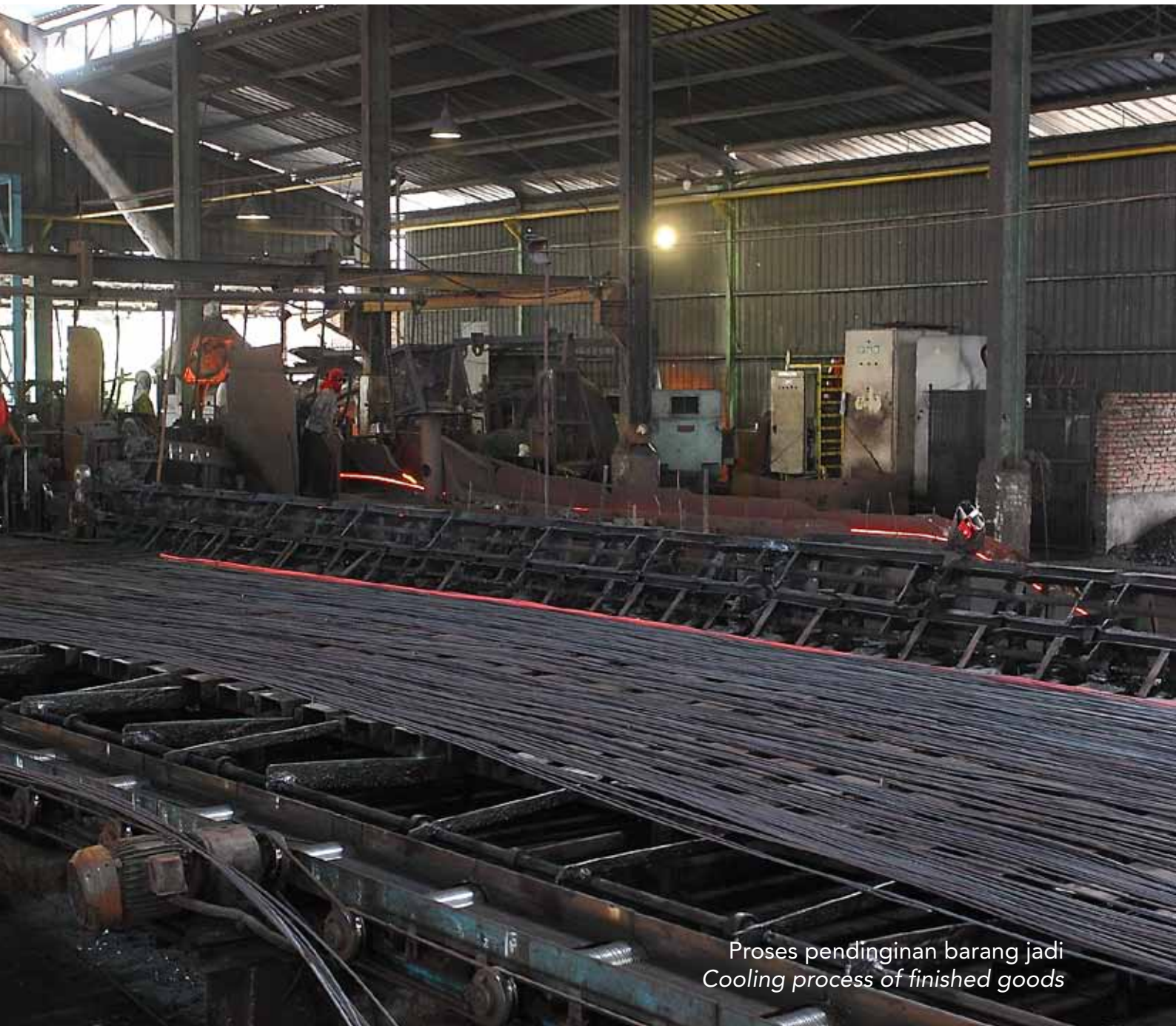
Proses pendinginan barang jadi Cooling process of finished goods

PT Surya Steel is a company engages in round bar industry. Two of five shareholders of PT Surya Steel are President Director and President Commissioner of the Company.