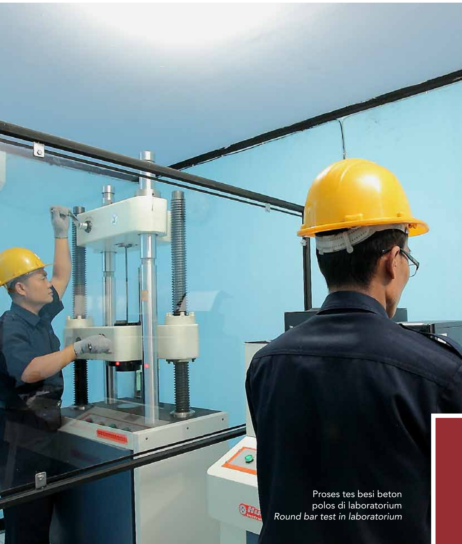
Proses tes besi beton polos di laboratorium Round bar test in laboratorium