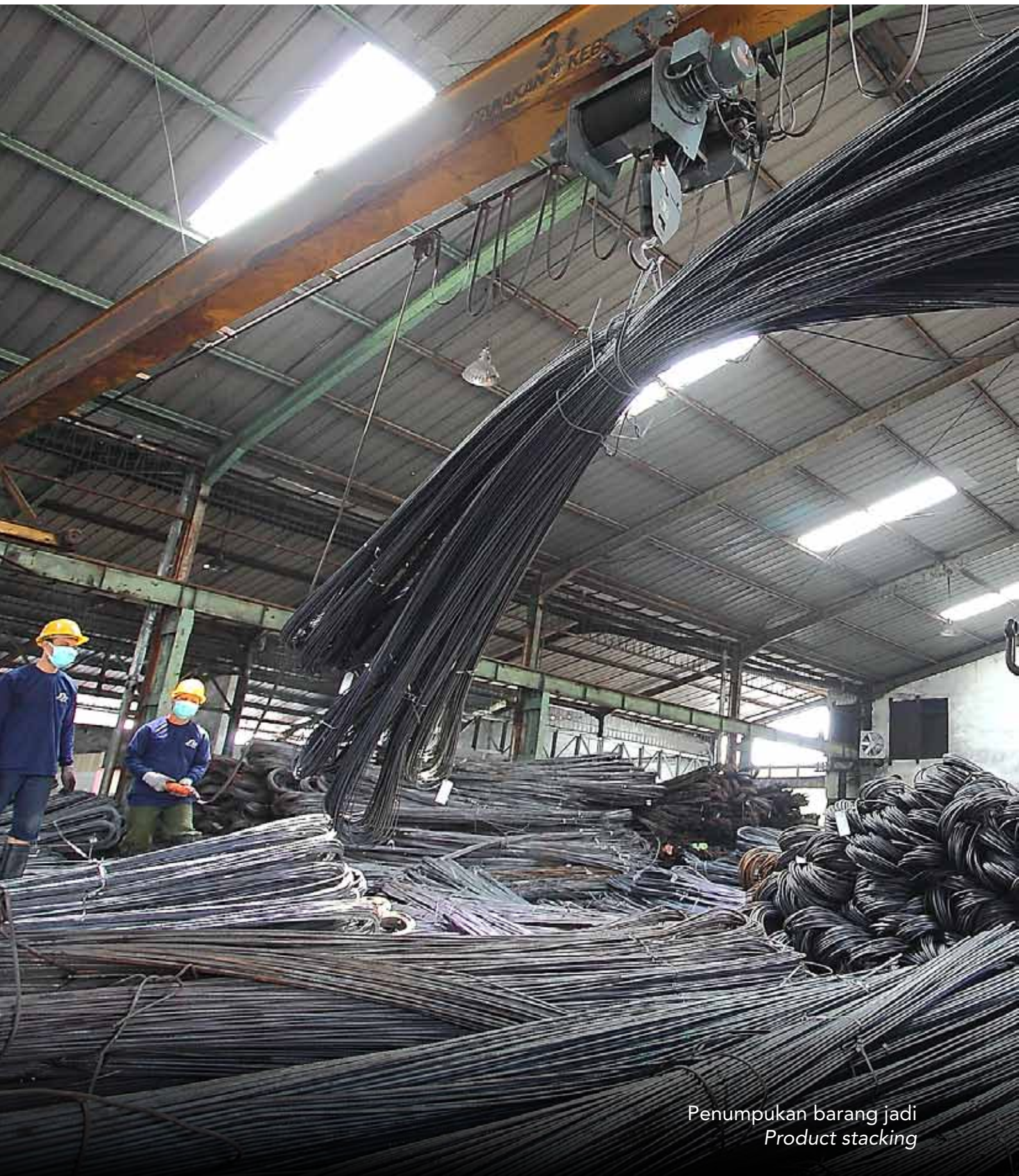
Penumpukan barang jadi Product stacking