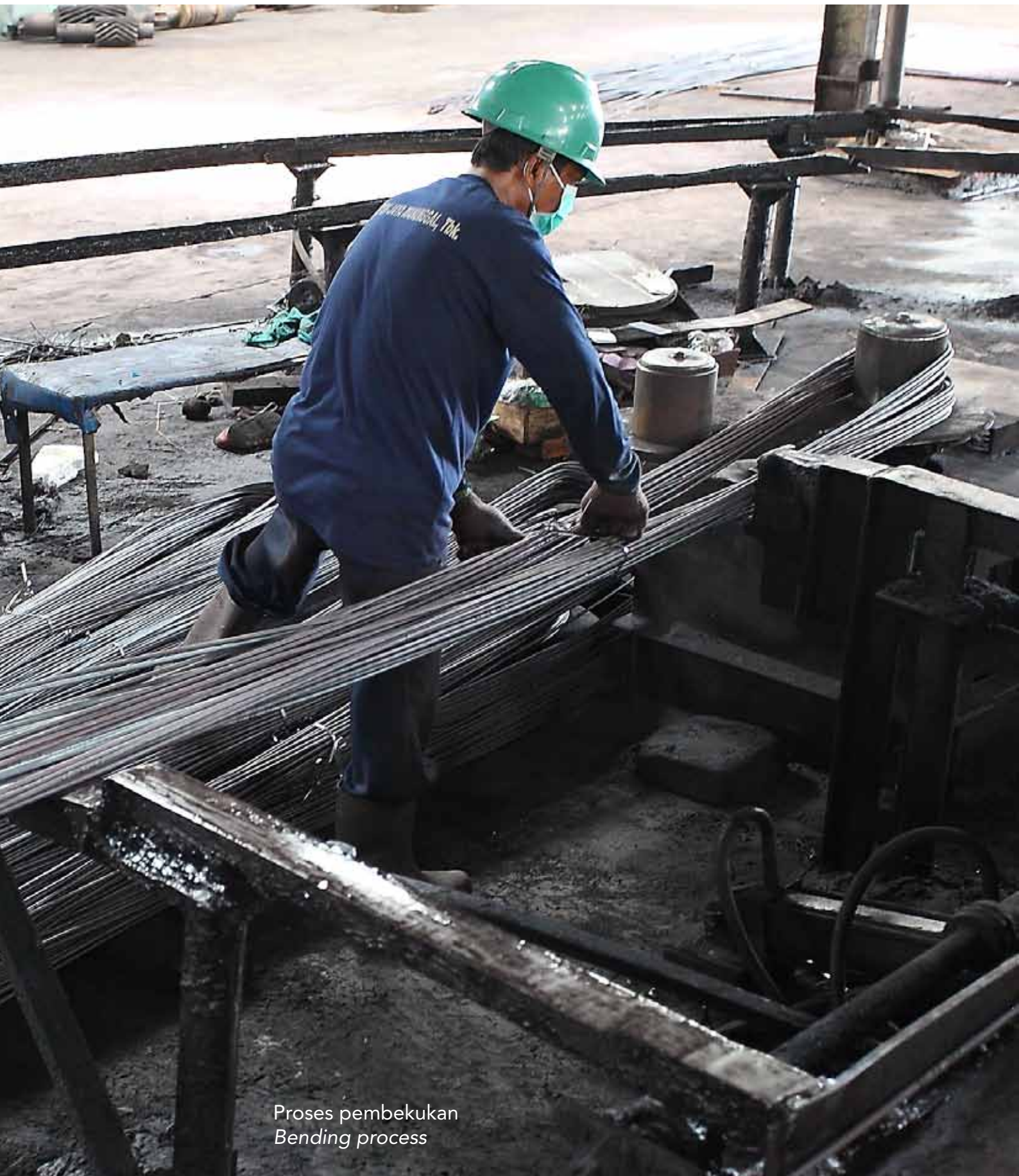
Proses pembekuan Bending process