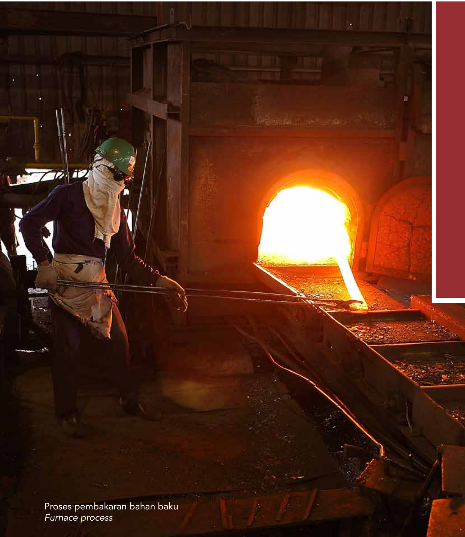
Proses pembakaran bahan baku Furnace process